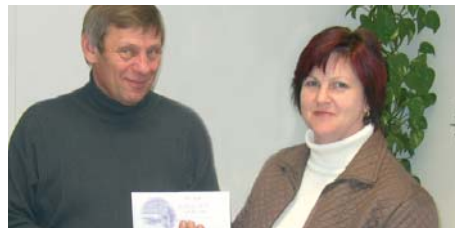
Gewinn-Überreichung durch die Betreuerin

Herzliche Gratulation und Danke für die 38-jährige Treue zur D.A.S.!