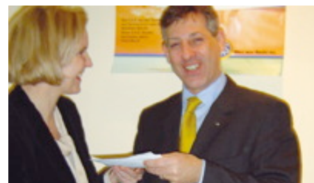
Gewinn-Überreichung im Maklerbüro

Im Gewinnspiel der letzten Ausgabe war die Frage zu beantworten, auf welchen Betrag Sie die Deckungssumme gegen bloß 10%igen Zuschlag erhöhen können. Richtige Antwort: € 100.000,-.