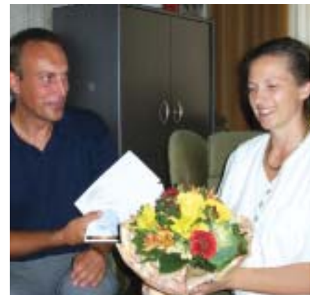
Gewinn-Überreichung in der Zahnarzt-Praxis

89 % der KONSULENT-Leser, die ihre Dialog-Antwortkarte aus der April-Ausgabe eingeschickt haben, haben sich auch am Gewinnspiel beteiligt.