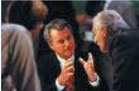
Wir arbeiten laufend an uns: der neue Arbeitskreis Kunden-Orientierung

Die D.A.S. setzt neue Maßstäbe. Für Sie.