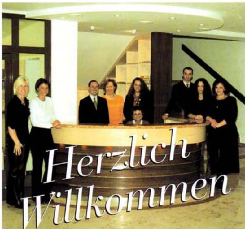
D.A.S. Team, das gerne für Sie da ist.