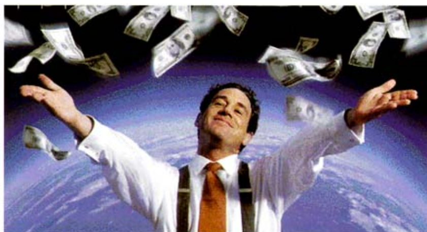
Die Vorteile von Franchising liegen auf der Hand.

Zwischen Franchise-Geber und Franchise-Nehmer besteht eine enge, auf Dauer ausgerichtete Zusammenarbeit. Der Franchise-Vertrag stellt das rechtliche „Kleid“ dieser Zusammenarbeit dar.