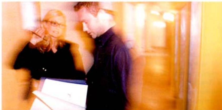
Der Beruf des Rechtsschutz-Beraters schafft zufriedene Kunden und erfüllte Berater. Zusätzlich: Tolle Berufs-Aussichten und guter Verdienst.