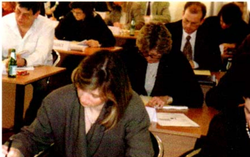
Auch Ausbildungskosten sind für Arbeitnehmer z.T. absetzbar.