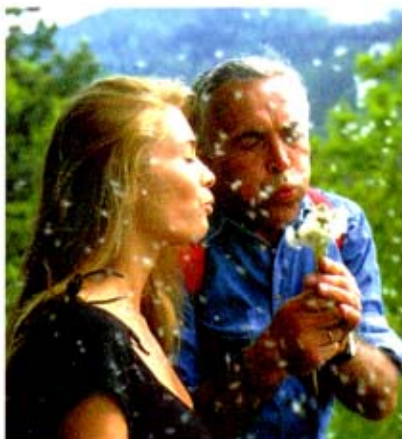
Welche Vorsorge-Leistungen steuerbegünstigt sind, erfahren Sie in diesem Artikel.

Die neue Pensionsförderung sieht Zuschüsse zu folgenden Vorsorgemaßnahmen vor: