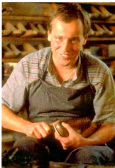
Die D.A.S. Rechtsschutz-Spezialisten helfen Ihnen auch bei Streitigkeiten im Ausland.

Kehren wir nun zu unserem Klein- oder Mittelbetrieb zurück. Unglücklicherweise